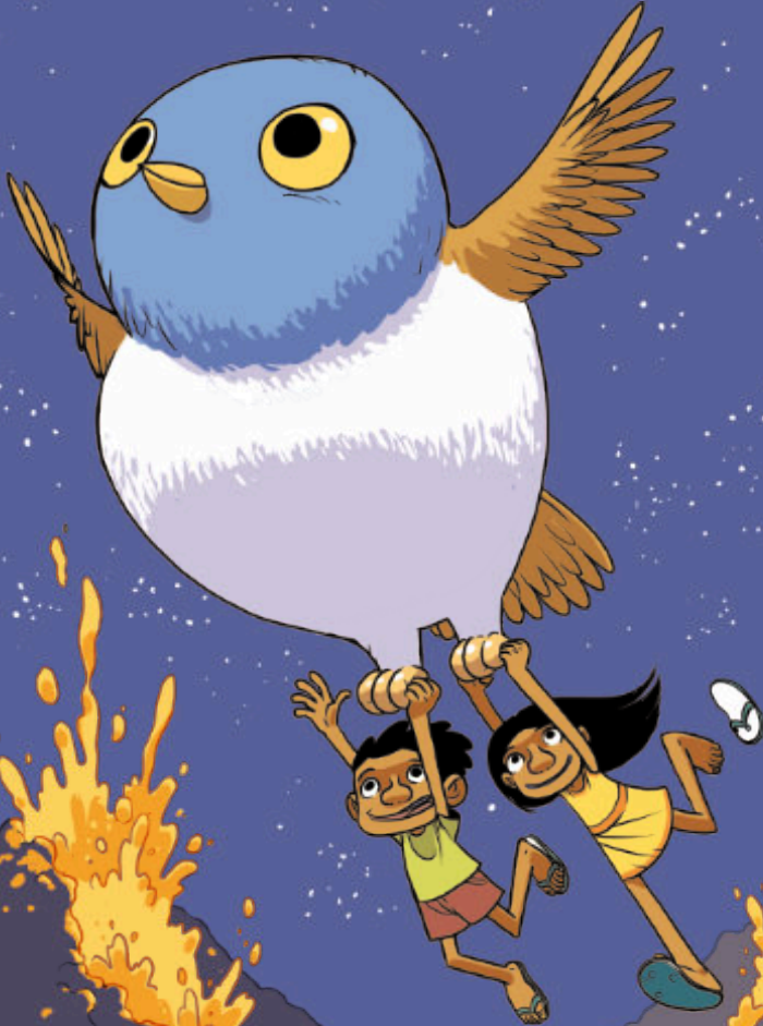
Illustration : Téhem