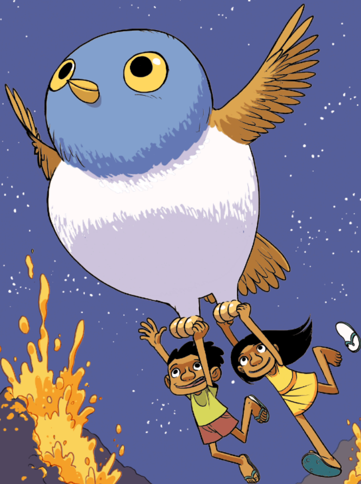
Illustration : Téhem